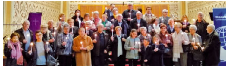
Encesa solidària a Sant Sadurn d'Anoia

L a cita anual a la nostra diòcesi d'aquesta ONG per al desenvolupament de l'Església tindrà lloc el proper 11 de gener a la Casa de l'Església. Serà present el bisbe Agustí, el consiliari Mn. Jaume Granés, i representants de totes les delegacions comarcals presents a Castelldefels, Sant Sadurn, Sitges, Vilafranca del Penedès i Vilanova i la Geltrú, i també el grup present a la parròquia de Cubelles. A l'assemblea es revisaran totes les